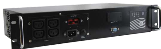
Intelligent II 600RMLT SE