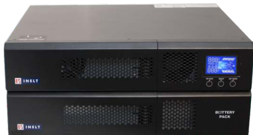
Monolith E 3000RTLТ с батарейным блоком BFR96-9E (приобретается отдельно)