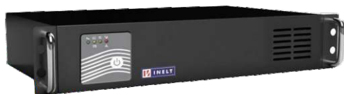
Intelligent II 600, 1000RM/RMLT