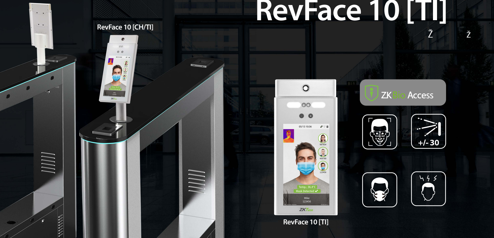
RevFace 10 [TI]

Терминал оснащен тепловизионной камерой, отображающей изображение на экране и специализированным процессором ZKTeco для распознавания лиц и новейшей технологии компьютерного зрения. Технология бесконтактного распознавания и новые функции обнаружения повышенной температуры, и определение наличия маски - все это особенно актуально в нынешней ситуации распространения вирусных инфекций.