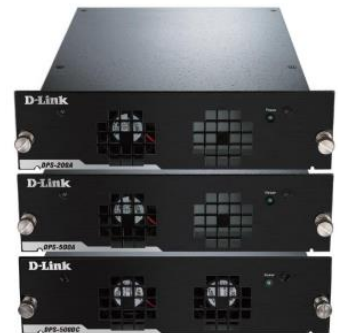
RPS DPS-200A, DPS-500A, DPS-500DC/B